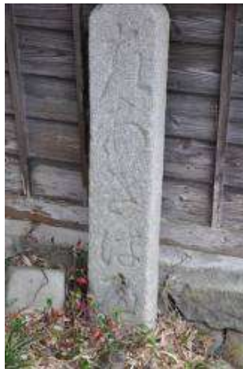
（「左あきはみち」の文字）