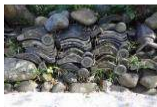
(遥拝所近くの古瓦)