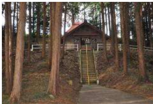
(木立の中の猿田彦神社)