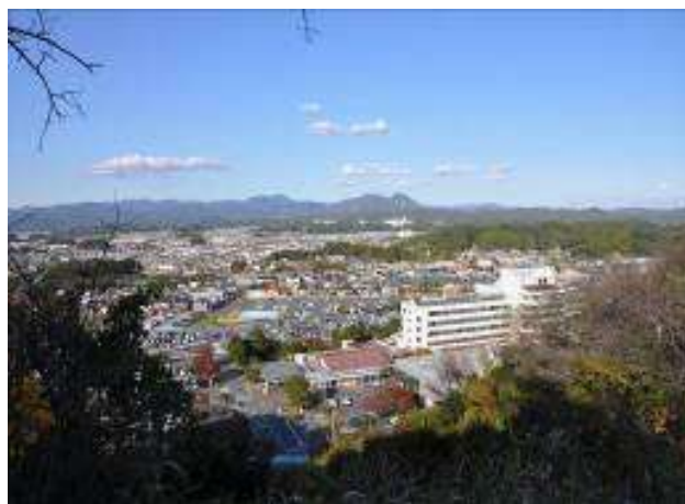
（陣場峠からの粟ヶ岳方面を望む）

この間、青田バス停から陣場峠までを除き車でもよい。駐車場・トイレは、応声教院、板沢神社、掛川市立病院にある。子供連れでもよいが大人向きである。食事のできる所は青田トンネルより北側に何軒かある。