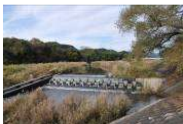
(原谷川土手からの眺め)