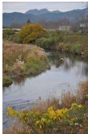
(原谷橋から上流を望む)