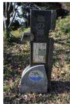
（陣場峠の野菊と塩の道モニュメント）