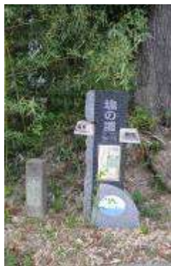
(道標・モニュメント)