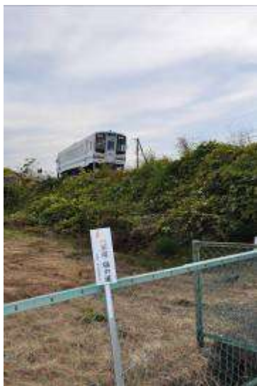
(天竜浜名湖鉄道と道標)

長福寺の門前にある「道標・塩の道モニュメント」の前を左折して西進し、県道掛川森線（県道40号）を横断した所に比較的新しい「石の道標（長福寺・役の行者堂・八幡神社までの距離が、昔の距離単位〈町〉で表示してある）」がある。さらに進んで、原谷の町を通る旧県道を突っ切って細い生活道路を行くと「天竜浜名湖鉄道」の小高い線路に突き当たる。線路沿いに右折すると原谷川の土手に出る。