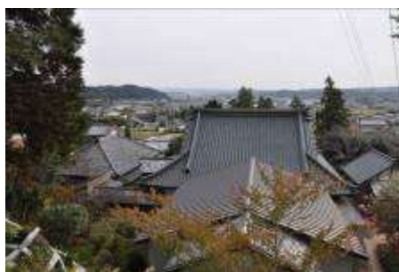
(本堂裏からの眺め)