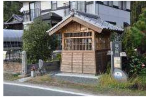
(福来寺下の秋葉燈鞘堂・塩の道モニュメント)