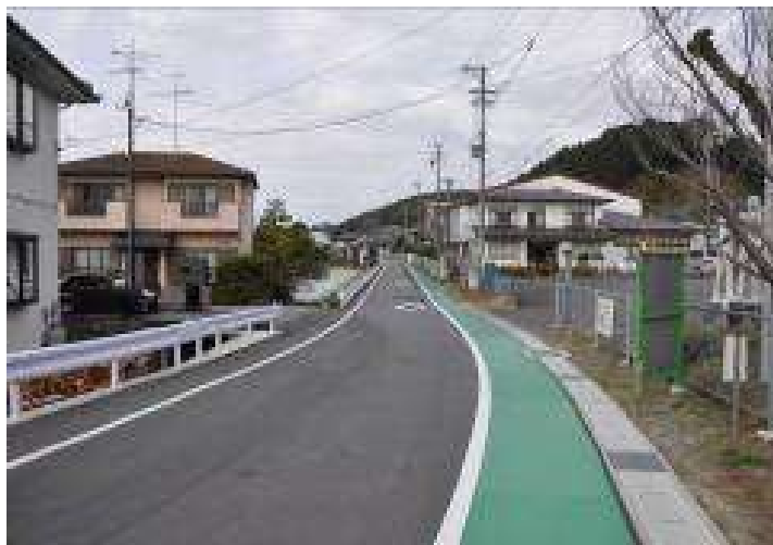
（上内田小から見た塩問屋跡、暗闇坂方面）

菊川市の応声教院を出て県道掛川小笠線（県道386号）を市内方面へ向かい、交差点を過ぎて御門橋の手前（川沿いではなくもう一本手前）を右折する。御門の秋葉燈三叉路を左に下り、上小笠川沿いに生活道路を進んで一旦県道へ出て市内に入る。再び旧道へ入り、桶田、段金谷、上内田、さらに下板沢から静鉄バス大坂線下りの青田停留所に出る。そして、その横にある秋葉神社祠左の狭い坂を上り、茶畑の中を陣場峠に至る。