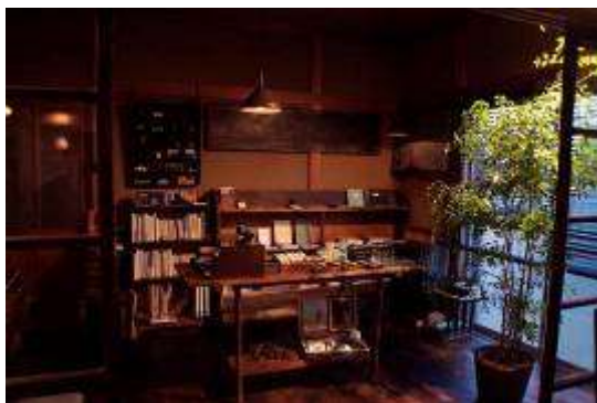
夕暮れ時の店内（文具売り場）