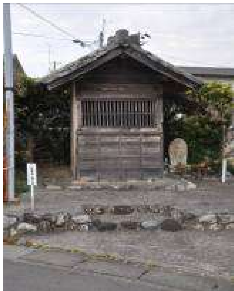
（段金谷の秋葉燈・庚申塔）