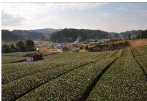
（板沢神社から県道掛川大東線方面を望む）