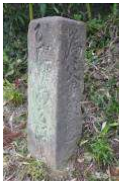
(「左あきはみち」の文字)