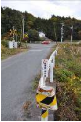
(突当りの旧県道から県道40号を望む)