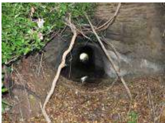
(素掘りのトンネル)