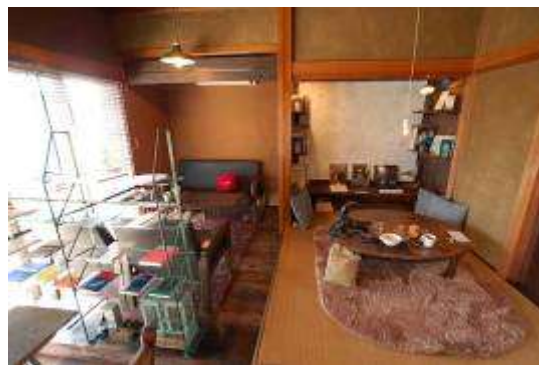
昼間の店内（喫茶スペース）