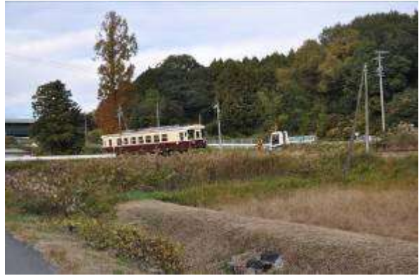
(市境を行く天竜浜名湖鉄道)

細谷からこの間は所々に細い道があり、やはり車の通行は無理である。計画を立てて歩くのを楽しみたい。子供向きの道ではない。食事は、県道掛川森線沿いに何軒かの食堂がある。駐車場は「若一王子神社」「長福寺」にある。「猿田彦神社」は車1台分くらいのスペースしかない。トイレは「若一王子神社」「長福寺」にある。