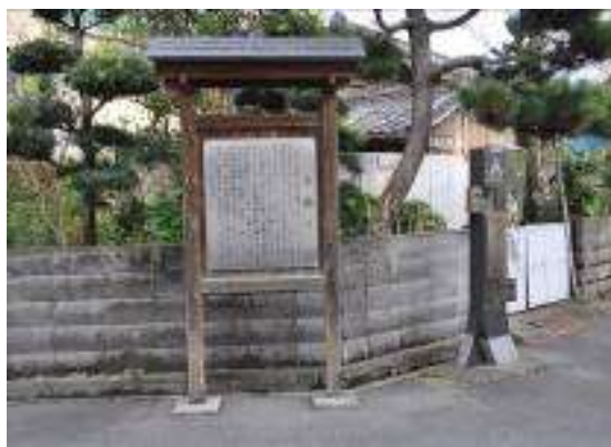
(七曲の説明板と旧東海道のモニュメント)

市内へはもう1本別道がある。味千ラーメンの交差点北西角の「揚張神社」を経て、「大日寺（キリシタン灯籠が有名）」の東側を通り、家並みを抜けて新幹線・東海道線ガード手前で県道掛川大東線（県道38号）へ出て塩町に至る道である。