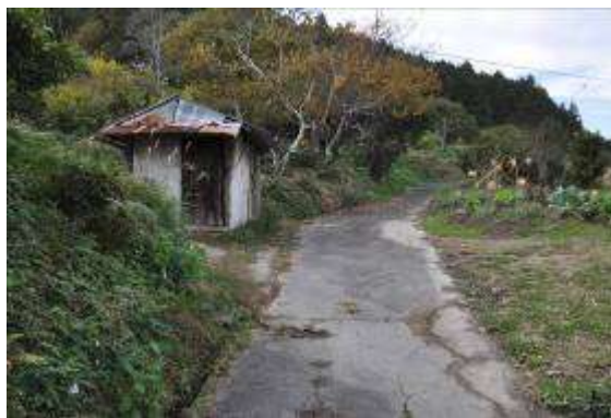
(農作業小屋のある道)

さて、猿田彦神社から先の本来の「塩の道」は、原田駅裏を通過した所から天竜浜名湖鉄道の線路、さらに県道掛川森線（県道40号）を横断し、右手の山上を通って森町に抜けていたが、現在は踏み切りの廃止と新東名高速道路の工事のために通行不能である。