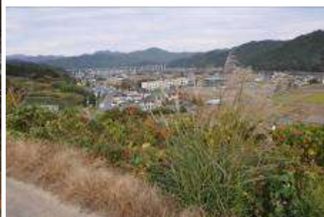
(猿田彦神社裏の茶畑からの眺め)

猿田彦神社左の急な坂道を下ると、天竜浜名湖鉄道の「原田駅」の裏に出る。駅を右手に見てさらに進むと、道は荒れて寂しくなる。訪れたのが秋だったので、道は芒に被われ、植林して放置されていると思しき栗の木から落ちた毬で埋め尽くされていた。車の通行は無理である。その道を進むと、天竜浜名湖鉄道に近づき、踏切を越えてくる旧県道に突き当たる。上には新東名高速道路が偉容を見せる。「猿田彦神社」からここまでは、県道掛川森線（県道40号）とほぼ並行するが両者をつなぐ道はない。